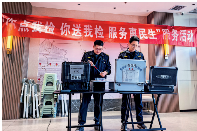
近日，河北省蔚县市场监管局开展食品安全“你点我检”“你送我检”快检工作 (赵旭江供稿)