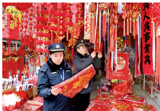
1月8日，江西省新余市渝水区市场监管局组织执法人员深入各类市场开展节前市场专项检查