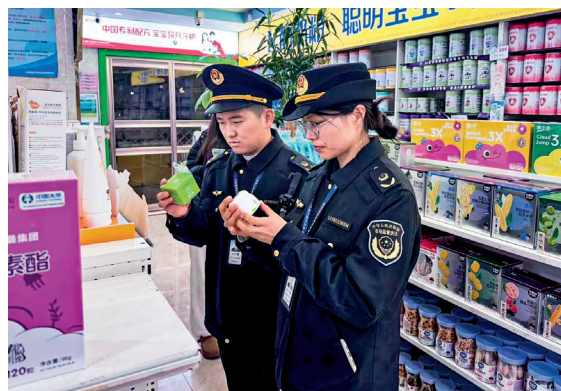
近日，安徽省和县市场监管局开展“双节”打假专项整治行动