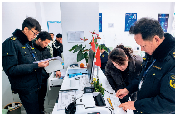
近日，云南省弥勒市市场监管局开展养老领域防范金融诈骗排查工作